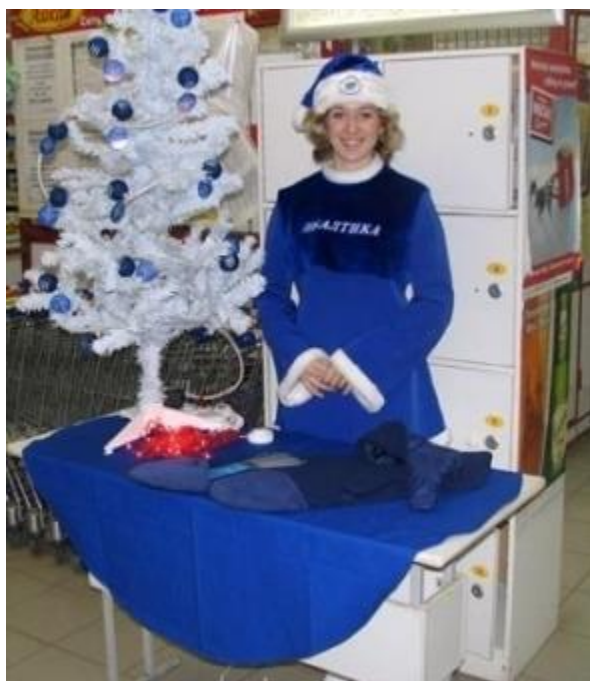
Промо-персонал от 200 руб/час