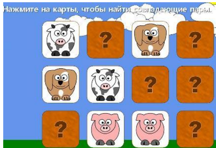
Награда по результатам игры