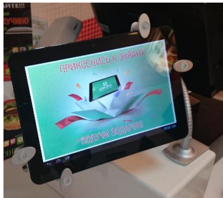
Планшет от 3 руб/час