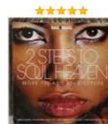
2 Steps To Soul Heaven Аудиозапись на CD