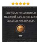
100 самых знаменитых мелодий классического джаза и рок-н-ро