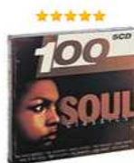
100 Soul Classics (5 CD) Аудиозапись на CD