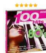
100 Hits Of The 80's (5 CD) Аудиозапись на CD