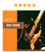
100 Blues Ballads (mp3) Аудиозапись на CD