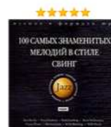
100 самых знаменитых мелодий в стиле свинг (mp3) Аудиозапись на CD