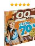
100 Hits Of The 70's (5 CD) Аудиозапись на CD