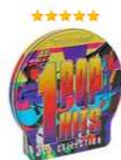
#1 Pop Hits. Special Edition (3 CD) Аудиозапись на CD