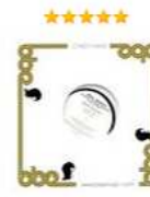
12 Inch Maxi (LP) Аудиозапись на CD