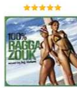
100% Ragga Zouk. Mixed By DJ Halan (2 CD) Аудиозапись на CD