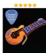
100 Years Of The Blues (2 CD) Аудиозапись на CD