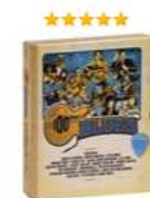
100 Years Of The Blues. From Mystical Gods To Modern Day (4 CD) Аудиозапись на CD